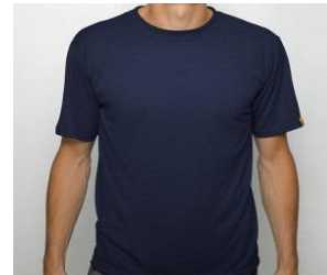
Cette photo par Auteur