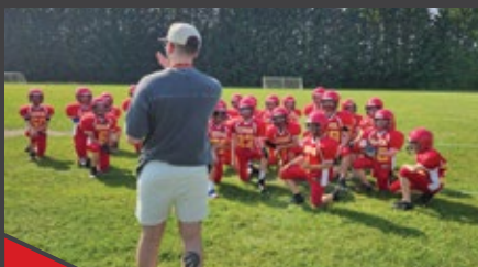
Équipe de football (RSEQ)