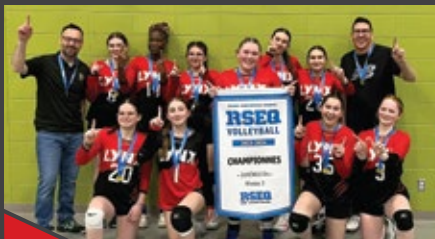
Équipes de volleyball (RSEQ)