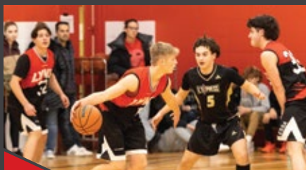
Équipes de basketball (RSEQ)